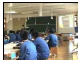
図3 作品(教材)を投影