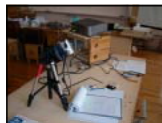
図1 ICTの構成例 (液晶プロジェクタ+デジタルビデオカメラ)

材料取りを行うにあたり、作業の内容や注意すべきポイントを示すスライドを拡大投影した（図