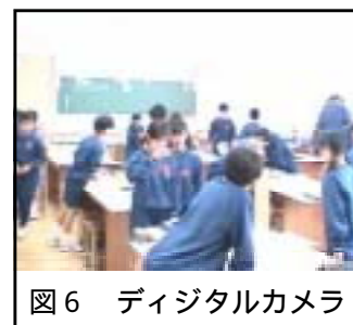
図6 デジタルカメラ

撮影した写真は各自のワークシートに貼り付け、本時の学習の記録としてファイルに綴じさせた。残念ながら検証授業の期間中にそれを活用することはできなかったが、このようなポートフォリオは既習事項を確認する際に役立つものと考えられる。